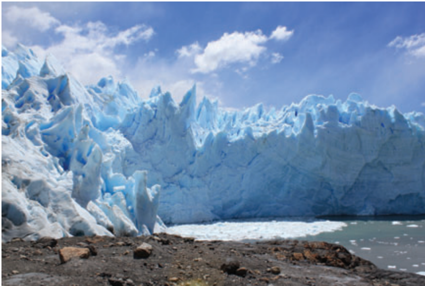
GLACIAR PERITO MORENO, EL CALAFATE – ARGENTINA “Quando canta o azul da água, a que cheira o rumor do céu?” Pablo Neruda