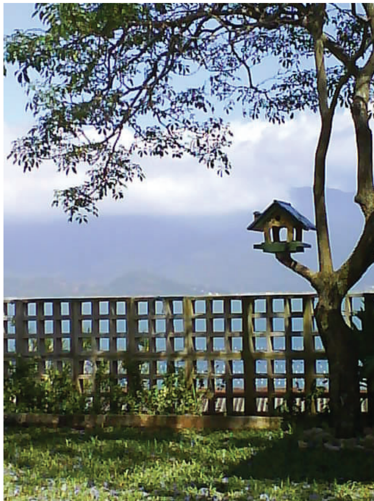
RIBEIRÃO DA ILHA

Ribeirão da Ilha, distrito de Florianópolis/SC, muito se parece com um ambiente oriental, pela singeleza e pela leveza da imagem.