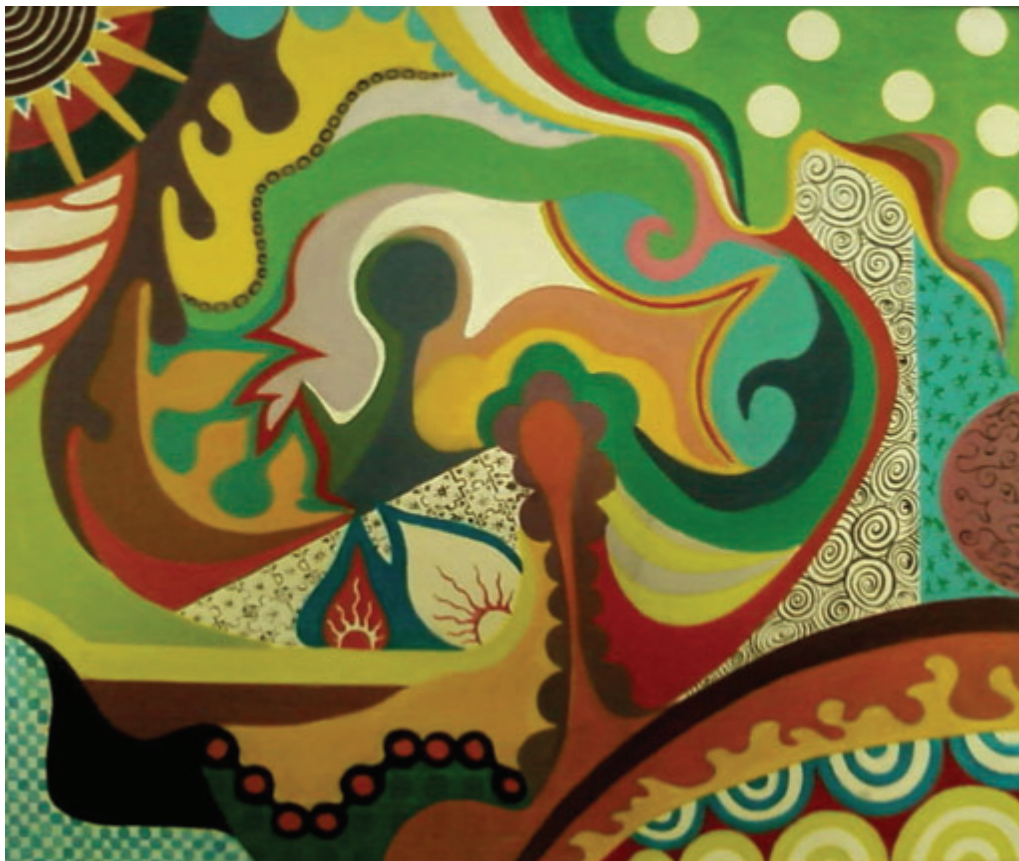
Quadro: "ALEGORIA DA ALEGRIA"

Ganhou o 2º lugar na Primeira Mostra de Talentos do Poder Judiciário.