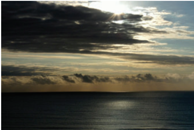
PRAIA DO GI – Laguna/SC

Durante o X Encontro dos Técnicos de Suporte em Informática em Laguna, tive a oportunidade de conhecer a bela e encantada Praia do Gi. Também consegui apreciar o pôr e o nascer do sol. Quem acorda cedo tem chance de presenciar o espetáculo que o sol e o mar desenharam o crepúsculo matinal.