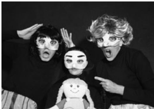
Foto retrata os personagens da peça "Dividindo Eu", do Teatro Dionisos de Joinville, na oportunidade do lançamento do Projeto Alienação Parental, de iniciativa da 2ª Vara de Família, no dia 27/04/11, no Fórum de Joinville. A peça foi contratada com recursos do Juizado Especial Criminal e que está sendo levada a algumas escolas municipais, estaduais e faculdades de Joinville.

Quem nessa vida, teve um pai e uma mãe mas foi dividido, Passou pela profunda dor que rasga o coração E faz de sua vida uma grande solidão. Quem nessa vida teve um pai afastado pela mãe, Não se doou, nem se deu, só chorou. O mal maior do que viver na solidão É ter pai e mãe, mas viver longe do pai Porque a mãe nunca curtiu uma paixão. É sofrer! É não ter nada não.