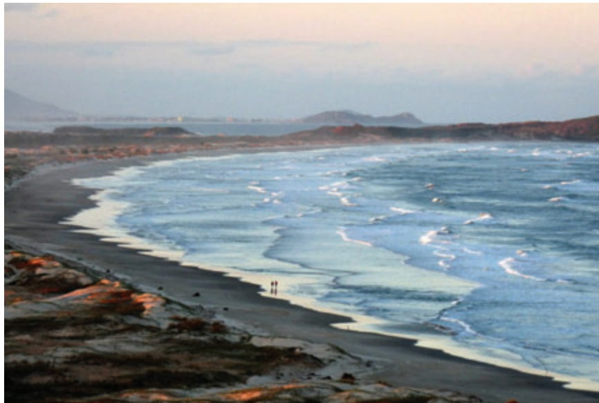
PRAIA DO GI – Laguna/SC