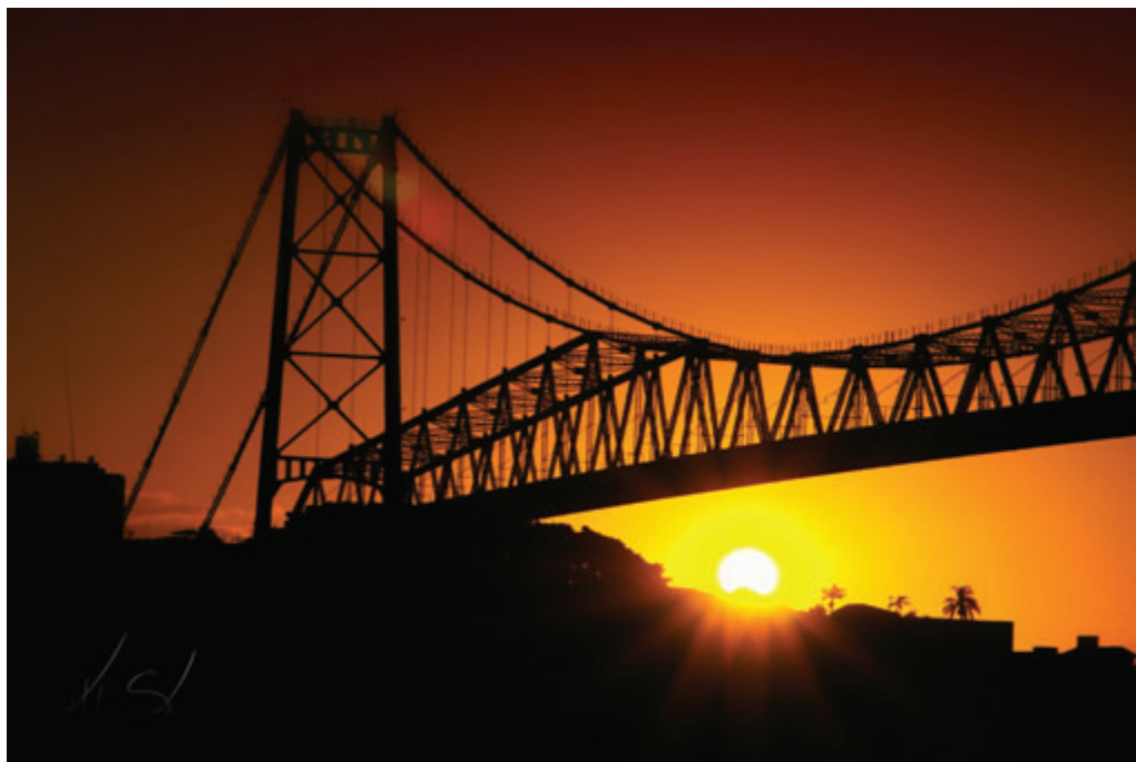
MEIA PONTE, MEIA ESTRELA

Uma imagem do lado de fora da ponte Hercílio Luz – não que ela não seja fotogênica – mas acho que um foto tirada de cima dela pode ser tão bela quanto.