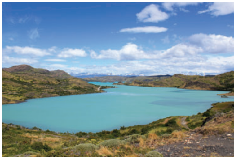
PARQUE NACIONAL TORRES DEL PAINE – CHILE “Se todos os rios são doces de onde o mar tira o sal?” Pablo Neruda